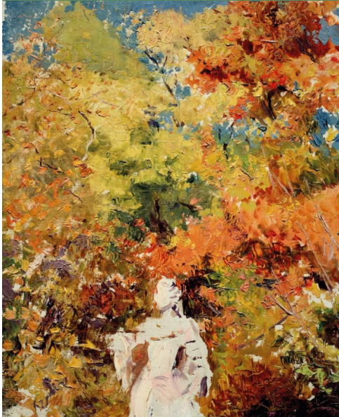
Joaquín Sorolla y Bastida, Árboles en otoño. La Granja, 1907, Museo Sorolla

Aula de Grados Facultad de Geografía e Historia Universidad Complutense de Madrid